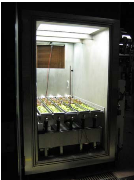
Salata rosnące na Grodan podłożu w komorze hiperbarycznej.

To zaawansowane i nadające się do przetworzenia podłoże uprawowe Grodan ne zostało stworzone specjalnie na potrzeby koncepcji „Precision Growing” – najwydajniejszego, najskuteczniejszego i zrównoważonego sposobu uprawy, który koncentruje się na użyciu jak najmniejszego nakładu środków (wody, energii, substancji odżywczych, przestrzeni) do wytworzenia jak najlepszych rezultatów (plony, jakość, czas produkcji). Właśnie tego szukają naukowcy z Kanady. Dla firmy Grodan współpraca ta wiąże się z wieloma korzyściami. Dzięki wynikom badań firma Grodan może bowiem dalej zaostrzać cele koncepcji Precision Growing. Precision Growing wysuwa się zatem na jeszcze bliższy plan, dzięki czemu hodowcy mogą jeszcze lepiej zarządzać swoimi uprawami, a co za tym idzie – ulepszać ich wyniki. W ten sposób misja na Marsa może pomóc nowoczesnemu ogrodnictwu w dalszym zrównoważonym rozwoju, a firma Grodan chętnie dokłada do tego swój kamyczek.